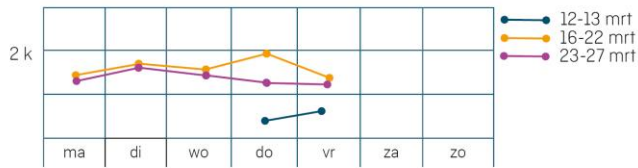
Beantwoorde Corona vragen