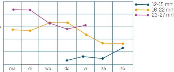
Sessies op Coronaloket