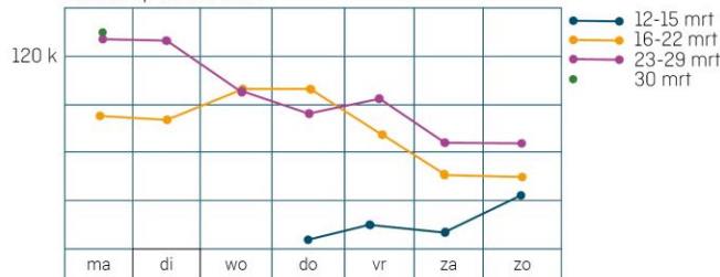
Sessies op Coronaloket