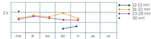
Beantwoorde Corona vragen